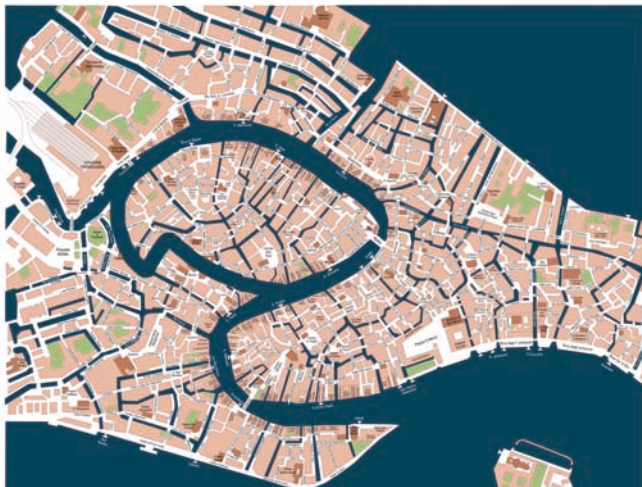
M+M Anello Grande, 2017